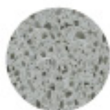
Cinza Light Premium

*Dimensões e espessuras especiais sob consulta