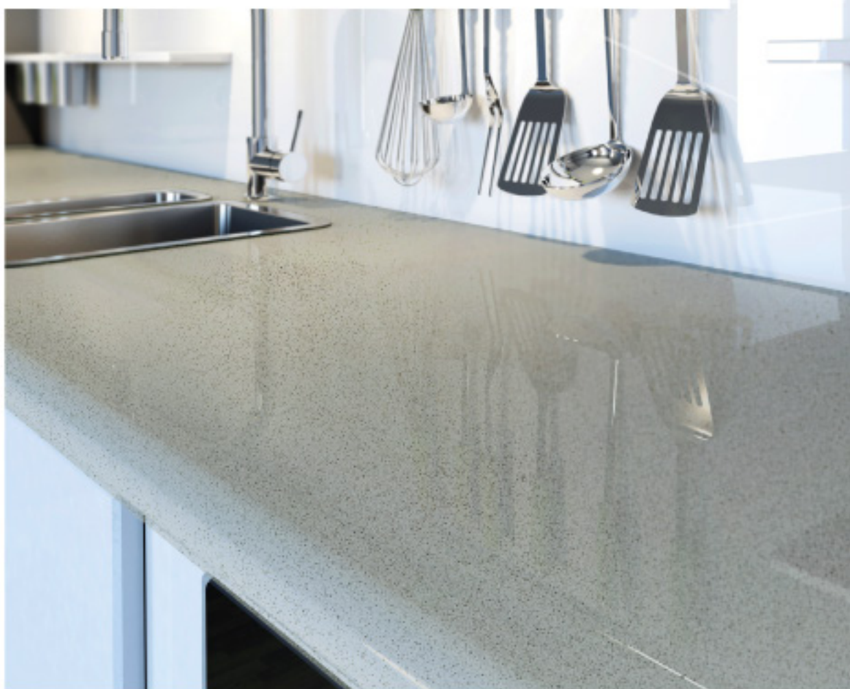
Bancada de Cozinha com Cinza Clean

Devido a aparência homogênea, as opções dessa linha são perfeitas para compor ambientes que exigem um toque de elegância e suavidade. Como qualquer superfície de quartzo, o uso é recomendado em ambientes internos, como bancadas de cozinhas, banheiros e lavabos, e também como revestimento para pisos ou paredes.